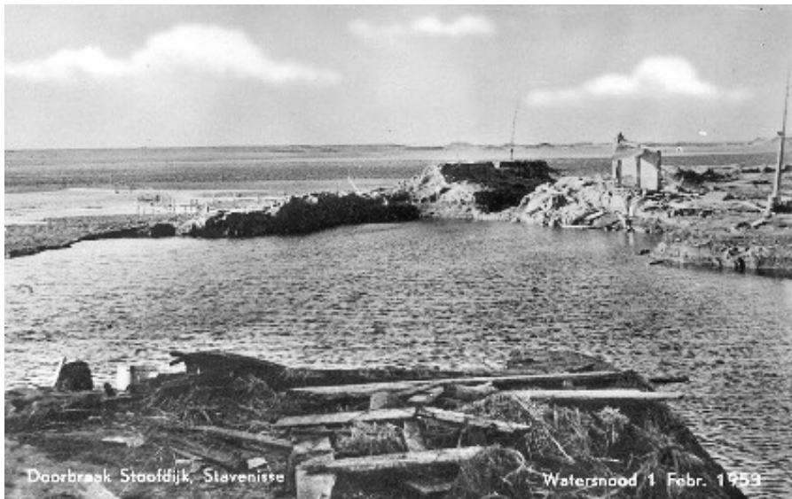
De Stoofdijk in Stavensisse, na de dijkdoorbraak, op 1 februari 1953.

1) Gemiddeld één keer per twee jaar is er een lage stormvloed . Het klinkt tegenstrijdig, maar een lage stormvloed is een extra hoge vloed gecombineerd met een storm. Die storm stuwt het water hoger op dan anders. Waarschijnlijk heet het lage stormvloed, omdat er ook hoge stormvloeden kunnen voorkomen, stormvloeden met een nóg hogere vloed. Dat gebeurt niet zo vaak. Een keer per honderd tot duizend jaar is er een hoge stormvloed.